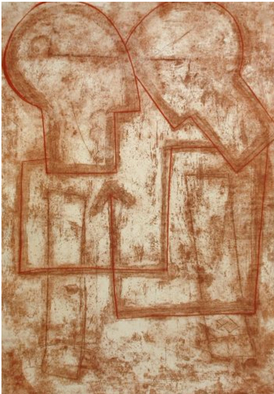
Pareja 2007, Guillermo Fornes 100cm. x 75cm.