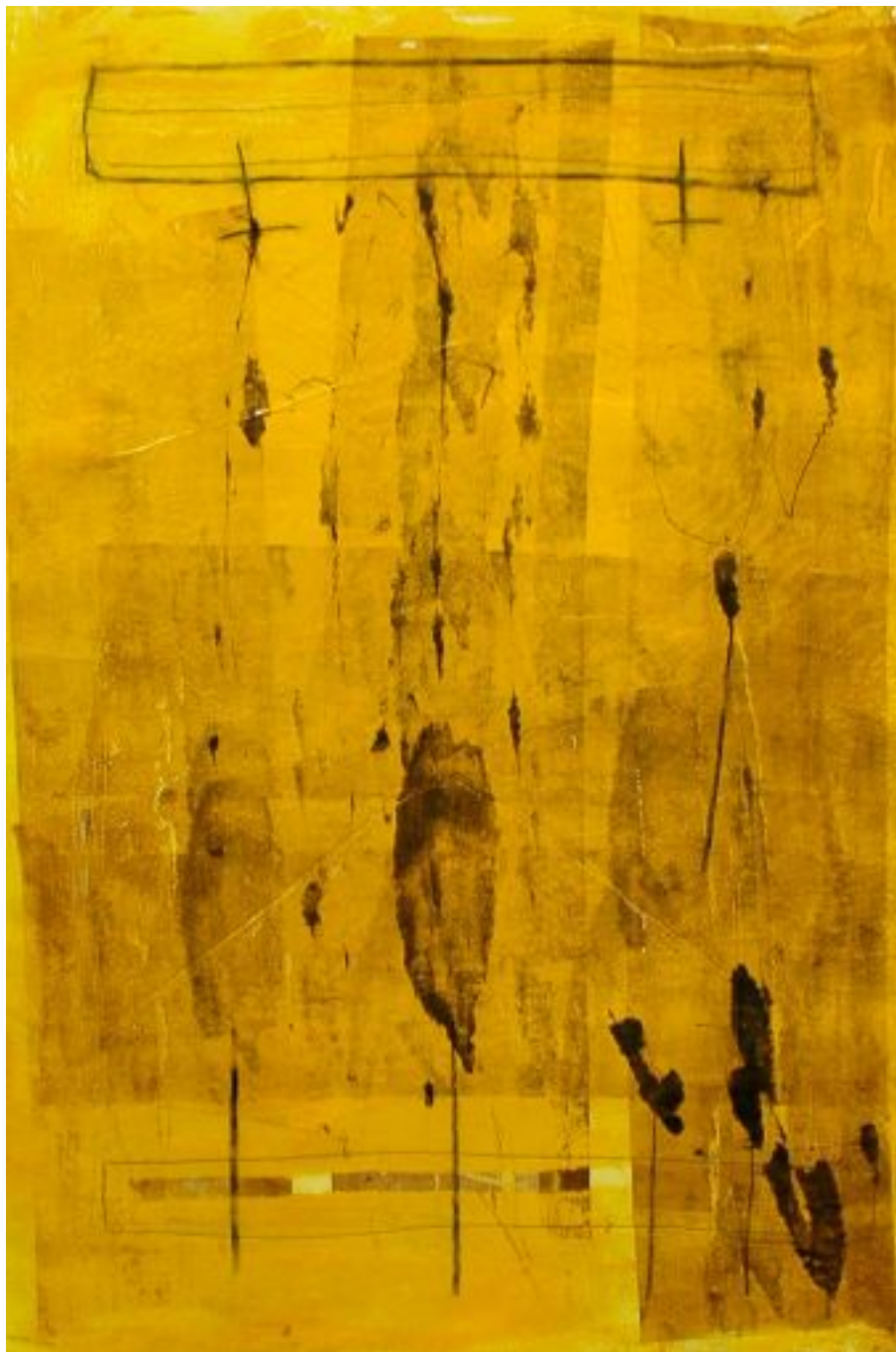
Dome 2006, Guillermo Fornes 108cm. x 76cm.