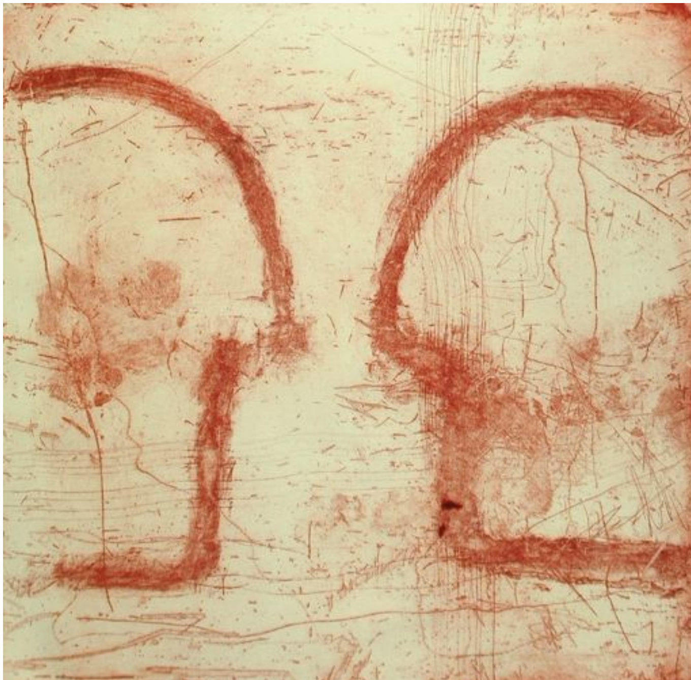
Cara a cara. 2005, Guillermo Fornes 68cm. x 58cm.