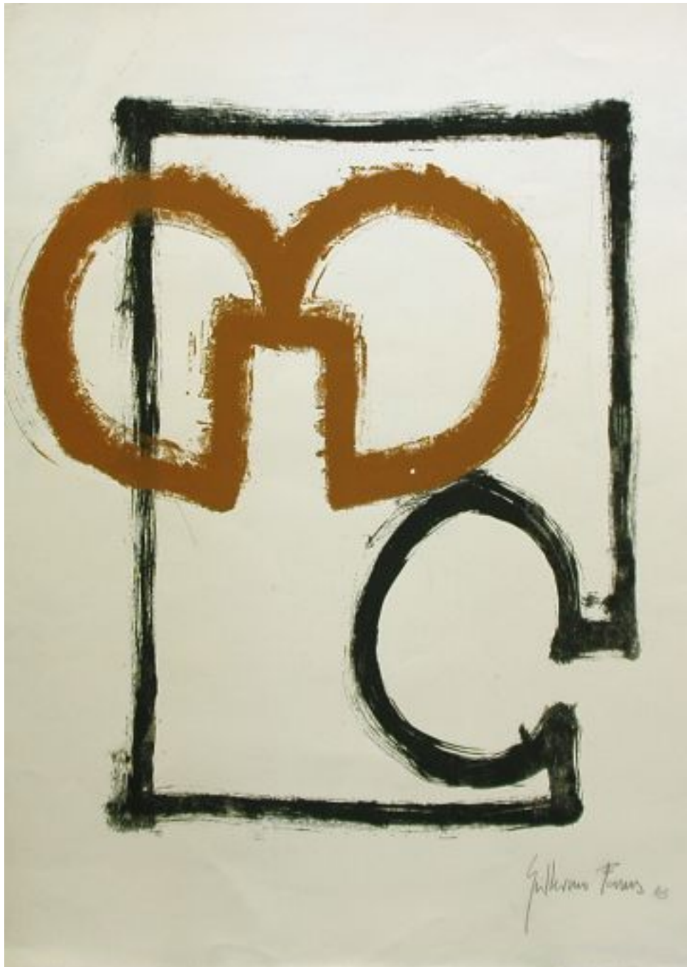
Pareja 2005, Guillermo Fornes 100cm. x 70cm.