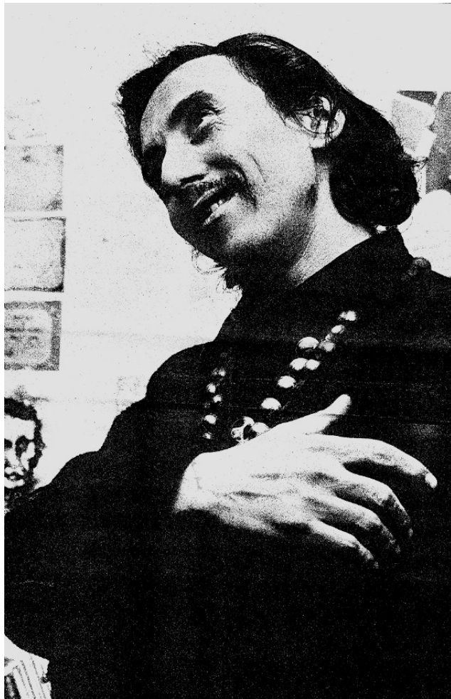
Due fotografie di Gianni Milano negli anni Sessanta