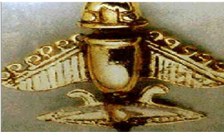
Figura 1. Un monile riprodotto un oggetto volante dell'antichità. Di particolare rilievo l'ala a delta. L'ala a delta è un tipo di ala utilizzata su velivoli che possono volare a velocità supersonica. Deve il suo nome alla particolare forma in pianta, pressoché triangolare, che richiama quella della lettera minuscola greca delta.

Alieno: diverso, estraneo, fuori di un determinato contesto. Essere dotato d'intelligenza proveniente da altro pianeta. Extraterrestre che abita altri mondi.