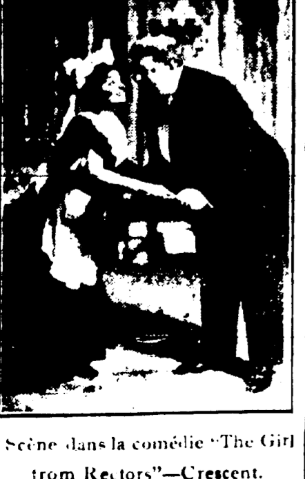
Scène dans la comédie "The Girl from Rectors"—Crescent.