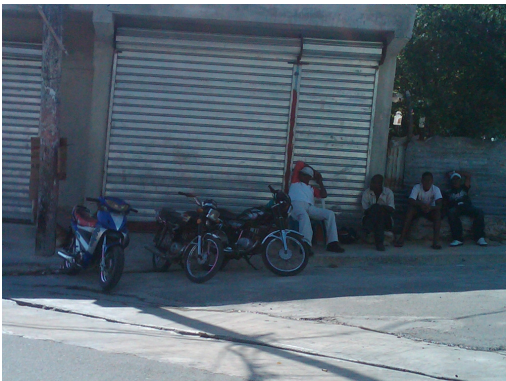
Parada de los moto concho

También se encuentran los vendedores ambulantes que dan un gran servicio a este barrio ya que se encargan de vender las frutas y otros productos necesarios para el barrio. Aquí en villa olímpica se vive del transporte urbano que gran parte de las personas que viven aquí se beneficia de este factor económico.