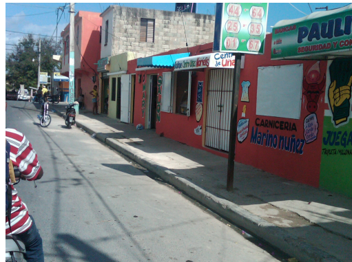
Una parte de los negocios