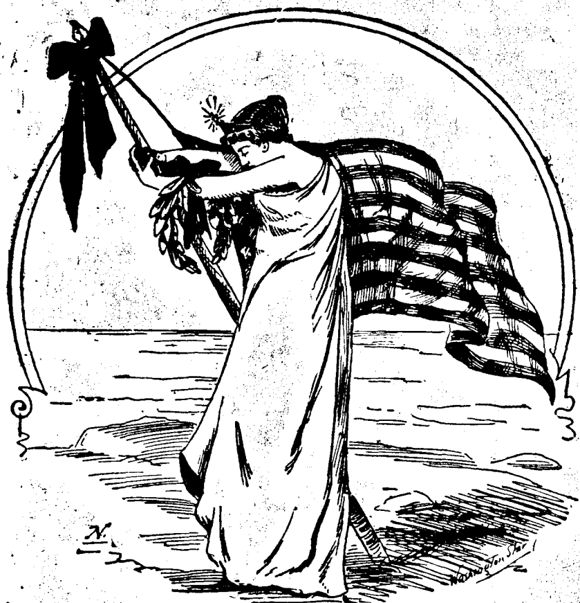
COLOMBE PLEURE SES PREMIÈRES VICTIMES.