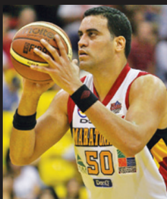
COAMO EN EL BSN