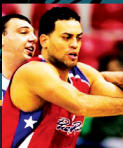
CON EL EQUIPO NACIONAL