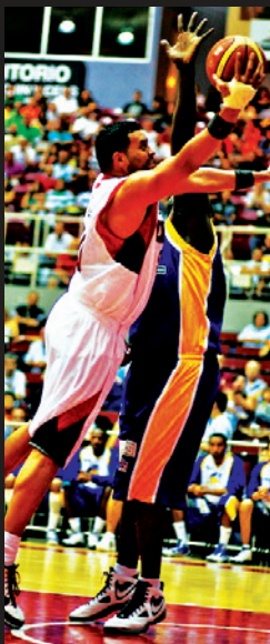
PONCE EN EL BSN