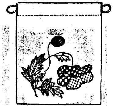
ORNAMENTAL SPONGE BAG.

The uncompromising ugliness of the ordinary sponge bag is admitted, and yet no outcry appears to have been made against it. There is really no reason