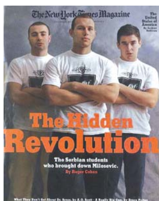
The Hidden Revolution. The Serbian students who brought down Milosevic (La revolución escondida. Los estudiantes Serbios que derrocaron a Milosevic) Portada de The New York Times Magazine

La otra cara de la moneda, pero que en realidad constituye una estrategia complementaria, es presentar a los jóvenes estudiantes triunfantes y desafiantes ante el “régimen dictatorial”. Les colocamos dos simples ejemplos, reproducidos también en este trabajo: