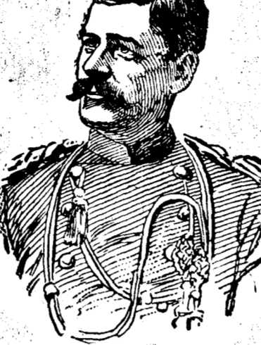
BRIG. GEN. HENRY W. LAWTON.