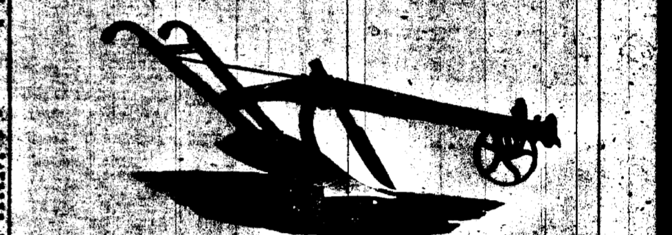
CHARRUE No 30-B POUR TERRES À SUCRE, TRANCHANT EN ACIER DE 10 POUÇES.

La légèreté de ces charrues offre le plus en plus pour les grands champs.