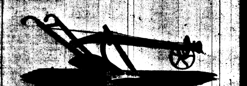
CHARRUE No 30-C POUR TERRES À SUCRE, TRANCHANT EN ACIER DE 10 POUÇES.