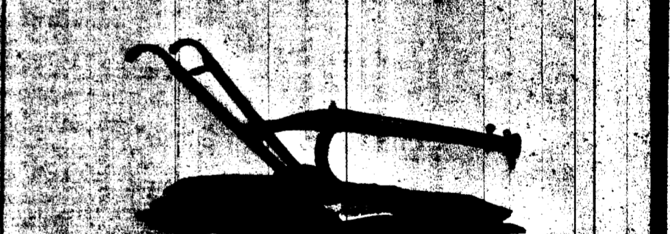
CHARRUE No 30-D, TRANCHANT EN ACIER DE 10 POUÇES.

C'est une merveilleuse charrue pour le nettoyage et la culture en général.