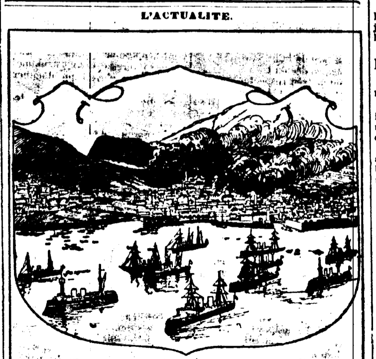
La Canée et les navires de guerre dans ses eaux.

— « Et bien, moi, interrompit le comte de Malabre, moi, Monsieur, je suis né à Chambéry, et, vous dire qu'on peut tout se permettre... »