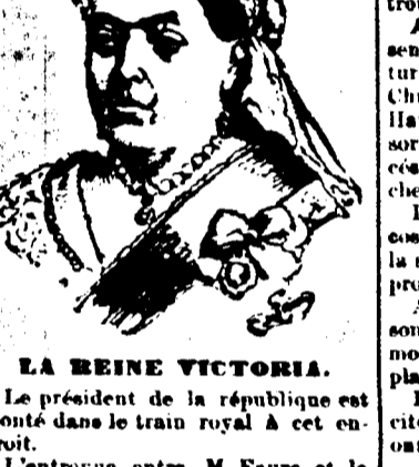
LA REINE VICTORIA.

Paris, France, 11 mars.—Le président Faure a eu une courte entrevue à Noisy-le-Mec, dans la banlieue de Paris, avec