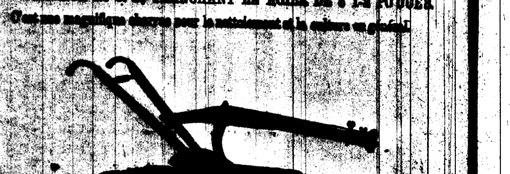
CHARRUE No 100-0 TRANCHANT EN ACIER DE 13 POUCES.

C'est une magnifique charrue pour le nettoyage et la culture en général.