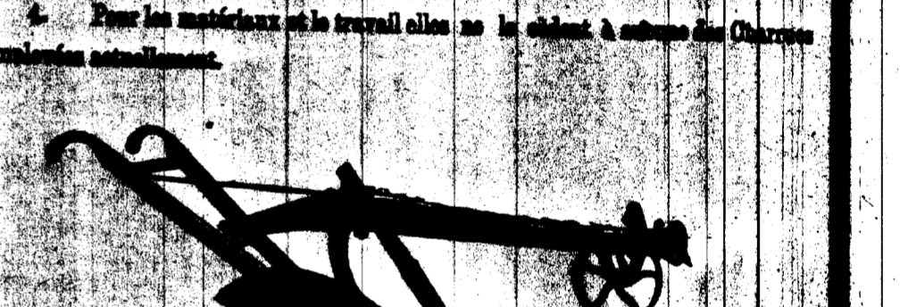
CHARRUE No 80-0 POUR TERRES A SUCRE, TRANCHANT EN ACIER DE 11 POUCES.