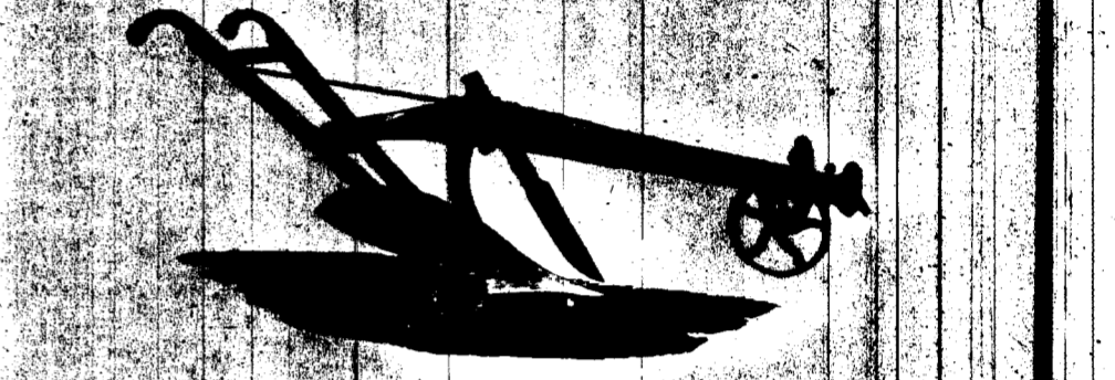
CHARRUE No 70-0 POUR TERRES A SUCRE, TRANCHANT EN ACIER DE 10 POUCES.

La réputation de ces charrues s'étend de plus en plus dans les grands Etats du Sud.