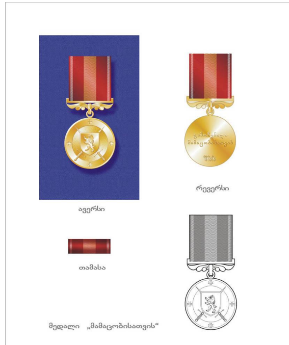
მედალი “მამაცობისათვის” (შსს თანამშრომელთა და სხვა პირთათვის)