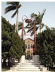
傅鐘，背景是文學院