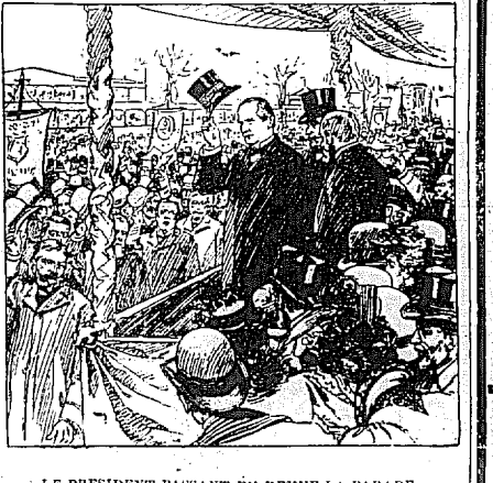
LE PRÉSIDENT PASSANT EN REVUE LA PARADE.