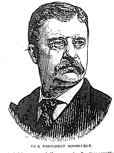
VICE PRESIDENT ROOSEVELT.