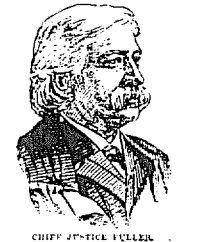
CHIEF JUSTICE FULLER.

Vers 7 heures les officiers du gouvernement qui s'étaient rendus aux casernes pour collecter les troupes sont partis et les soldats commencent à affluer de tous les côtés vers l'avenue de l'inauguration.