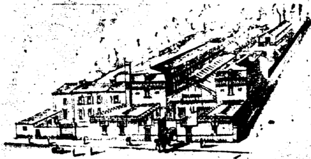
LABORATOIRE, SERRES ET USINE MARIANI À NEULLY-SUR-SEINE, FRANCE.