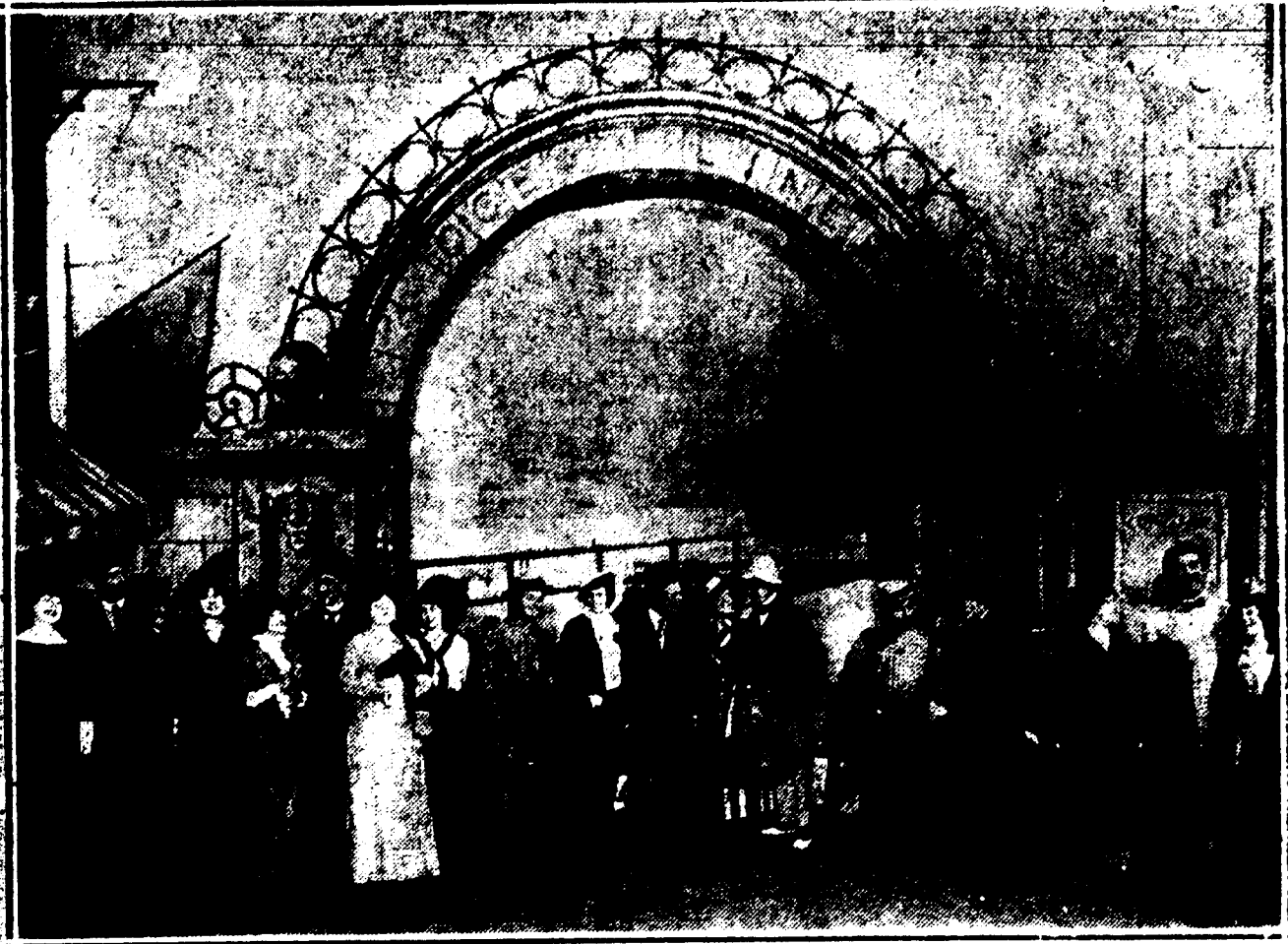
LA TROUPE MARX BROTHERS A L'ORPHEUM.