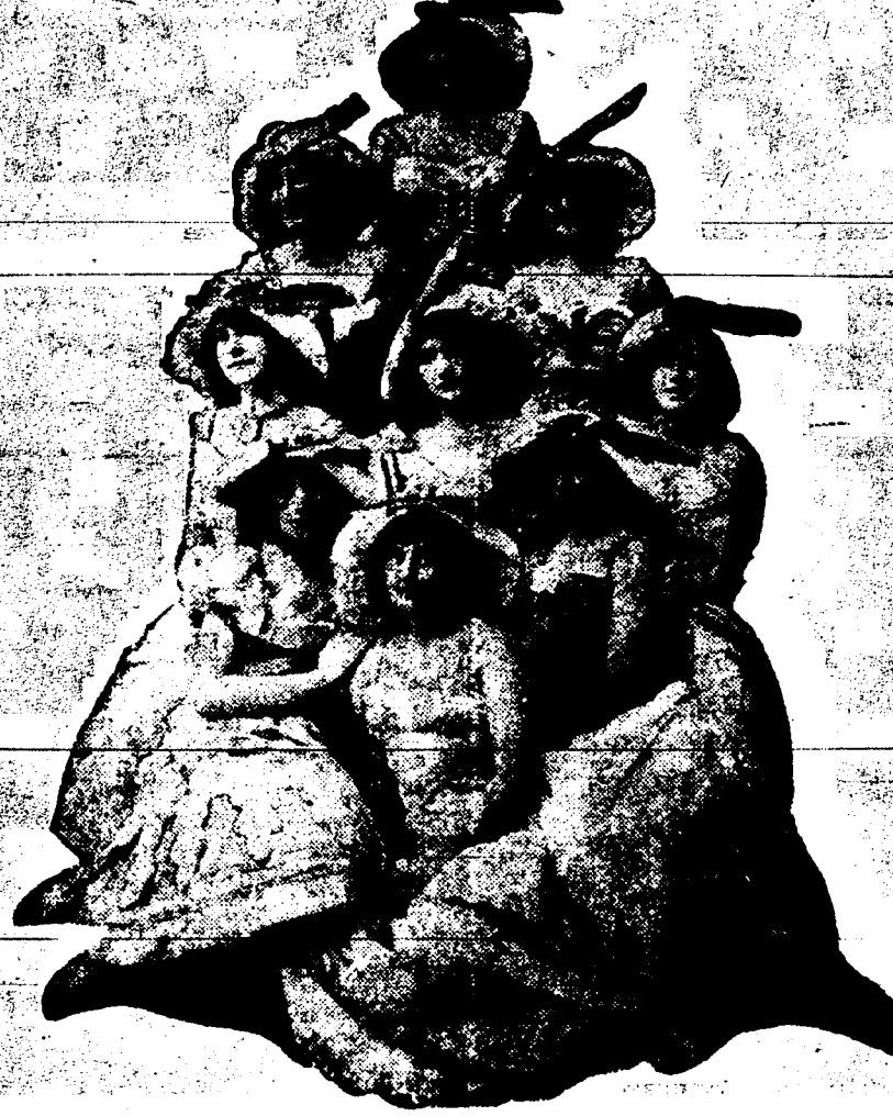
UNE PYRAMIDE DE JEUNES BEAUTES AU TULANE DANS EVERYWOMAN.