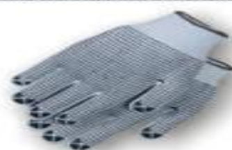
Guantes de hilo entretejido con puntos de PVC en ambos lados.