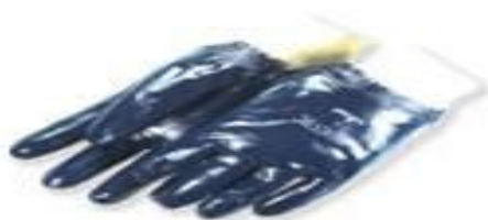
Guantes cubierto de Nitrilo con puño tejido y actifresh.