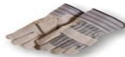
Guantes de cuero cromo tipo Petrolero.