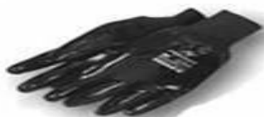
Guantes de Neoprene de 10" con puño de tejido y actifresh.