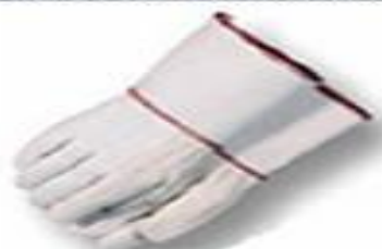
Guantes de algodón de 28 oz. Para altas temperaturas.