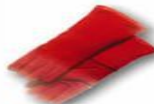
Guante de cuero cromo de soldador de 14" en una sola pieza.