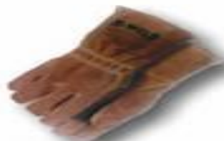
Guantes de soldador con hilo Kevlar y retardante de llama de 14".