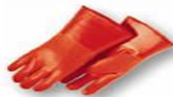
Guantes de PVC naranja de 12" para bajas temperaturas.