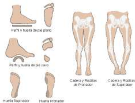
Figura 3 [4]

En muchas ocasiones, los pies en posición estática pueden comportarse de forma totalmente distinta a cuando están en movimiento, al desplazarse. Se puede dar el caso de que unos pies con pisada neutra en posición estática pueden transformarse en pies planos durante el desplazamiento o los pies cavos pueden cambiar a pies normales o incluso pies planos.