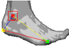
figura 4 [4]

Los motores de combustión interna queman una mezcla de aire comprimido y combustible dentro de la cámara de combustión del cilindro para generar potencia. Mientras que los motores a diesel siempre han utilizado inyectores para hacer fluir hacia adentro el combustible, los de gasolina utilizan el carburador para mezclar el combustible con el aire.