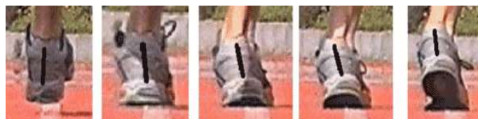
Figura 2 [4]

Primero analizaremos una pisada normal, eficiente o biomecánicamente correcta. Durante el paso, de manera general, la primera zona que hace contacto con el suelo es la parte externa del talón, esto se debe a que el tobillo se mueve hacia su lado externo definiendo un movimiento de supinación, este movimiento es normal y es previo al primer contacto.