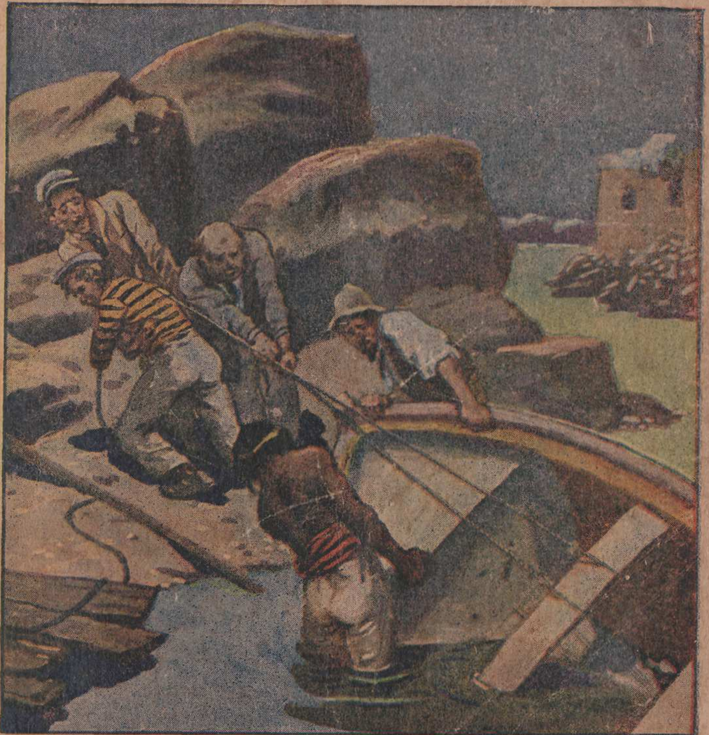
Die Gefährten zogen das leckgeschossene Boot an Land.