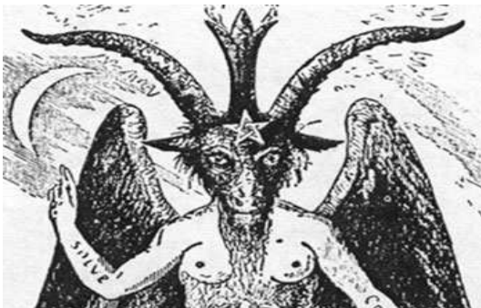
மூன்றாம் மிருகம் பூமியில்