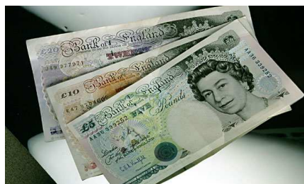
இங்கிலாந்தில் உலகிலயே முதன் முதலாக காகிதத்தில் பணம் அச்சிடப்பட்டது. காகித வெற்று தாள்கல் மாயமாக தங்கத்தின் இடத்தை பிடித்தது.

இங்கிலாந்தில் தான் உலகிலயே முதன் முதலாக காகிதத்தில் பணம் அச்சிடப்பட்டது. ஆதியிலே தங்கம், வெள்ளி மற்றும் செப்பு காசுகள் மட்டும் தான் பணமாக பயன்படுத்தப்பட்டது. காகித வெற்று தாள்கல் மாயமாக தங்கத்தின் இடத்தை பிடித்தது. இந்த காகித தாள் பணத்தை அச்சிட்டது ஃப்ரீமேஸன் FREEMASON மற்றும் சியொனிச யூதர்களின் ZIONIST JEWS வங்கிகலே. ஆதலால் இங்கிலாந்து தேசமும், உலகமும் யூதர்களின் ரகசிய கடுப்பாட்டில் ஆட்சி செய்யப்பட்டது. இதுதான் இரண்டாவது மிருகத்தின் இரகசிய ஆளுகை.