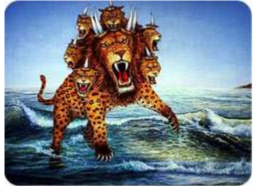
இரண்டாம் மிருகம் சமுத்திரத்தில்