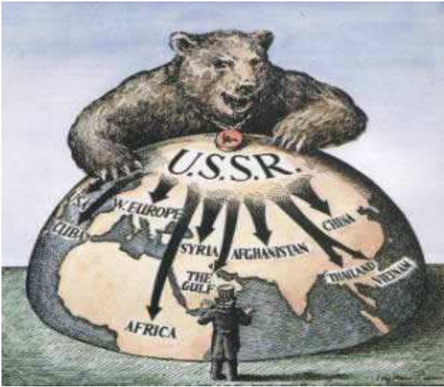
ரஷ்யாவின் தேசிய மிருகம் கரடி