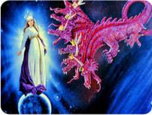
முதல் மிருகம் வானத்தில் ஸ்திரீயுடன்