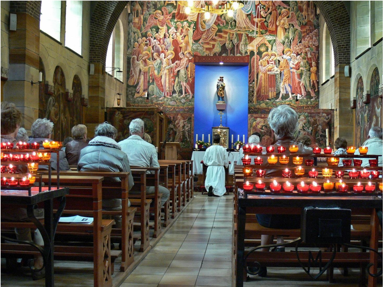
Onze-Lieve-Vrouwe-ter-Noodkapel in Heiloo

Lijkt een echt Limburgs plaatje, maar staat in Noord-Holland. Sfeervolle foto. Zegt daardoor ook iets minder over het monument, maar meer over het gebruik ervan. Foto met een interessant verhaal.