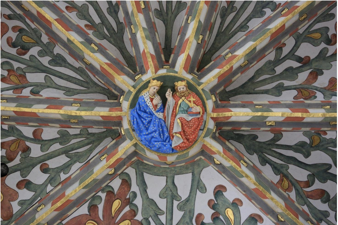
Kruisgewelfdetail van de Grote of Onze-Lieve-Vrouwekerk in Breda

Mooi detail in een detail. Technisch perfect, en biedt voldoende mogelijkheden om nog verder in te zoomen. Indrukwekkend, de fotograaf is hier duidelijk lang mee bezig geweest. Deze foto was de beste foto uit een serie kruisgewelffoto's. Deze serie als geheel had een goede kans gemaakt voor de fotodocumentaireprijs als hij was ingediend. Het onderwerp van de foto is net iets te eenvoudig voor een van de topplekken.