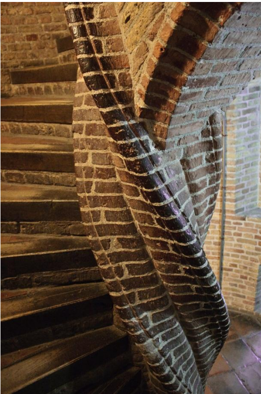
Fotograaf: Farlukar Wenteltrap van het Prinsenhof in Delft