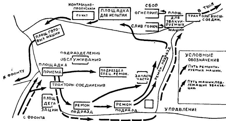
Схема восстановления машин на СПАМ