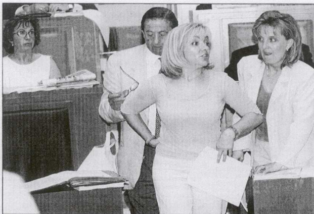
La consejera de Economía de la Junta durante el debate de la Ley de Estadística en las Cortes el pasado día 29.

Ahora comienza la fase de creación de los distintos órganos previstos en la propia norma. El director general de Estadística, Fernando Mallo, calcula que en un periodo de un año estará elaborado el Plan Estadístico de Castilla y León. "El 2002 será el primer año del Plan". Seis meses menos se tardará, según las previsiones, la creación del Consejo Asesor de Estadística que