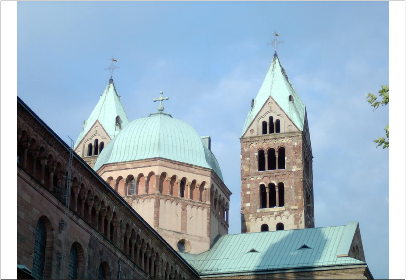
Dom zu Speyer, erbaut auf Anweisung Konrads II., in seiner jetzigen Form vollendet 1106