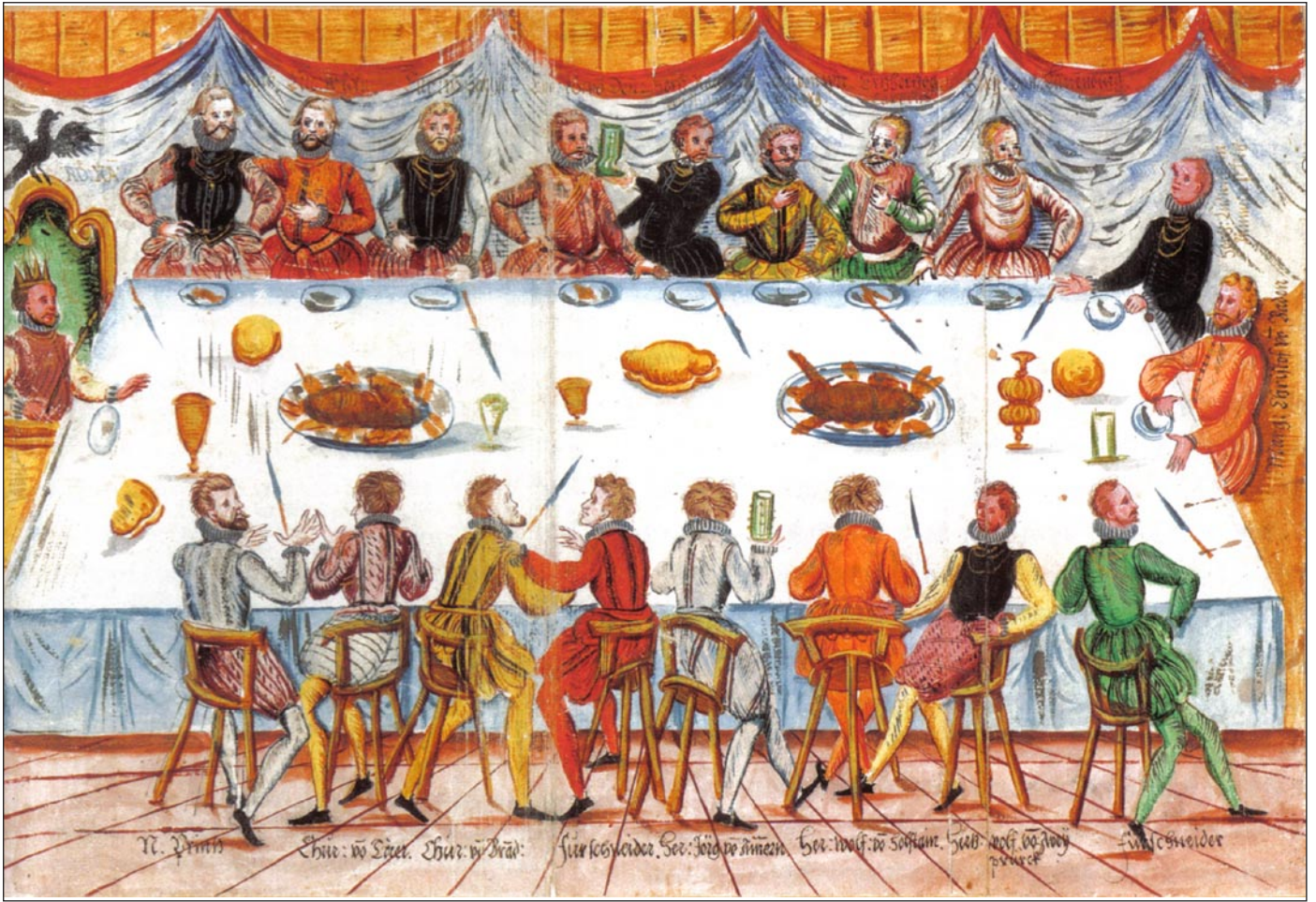
Krönungsmahl Kaiser Feridnands I. im Frankfurter Römer 1558