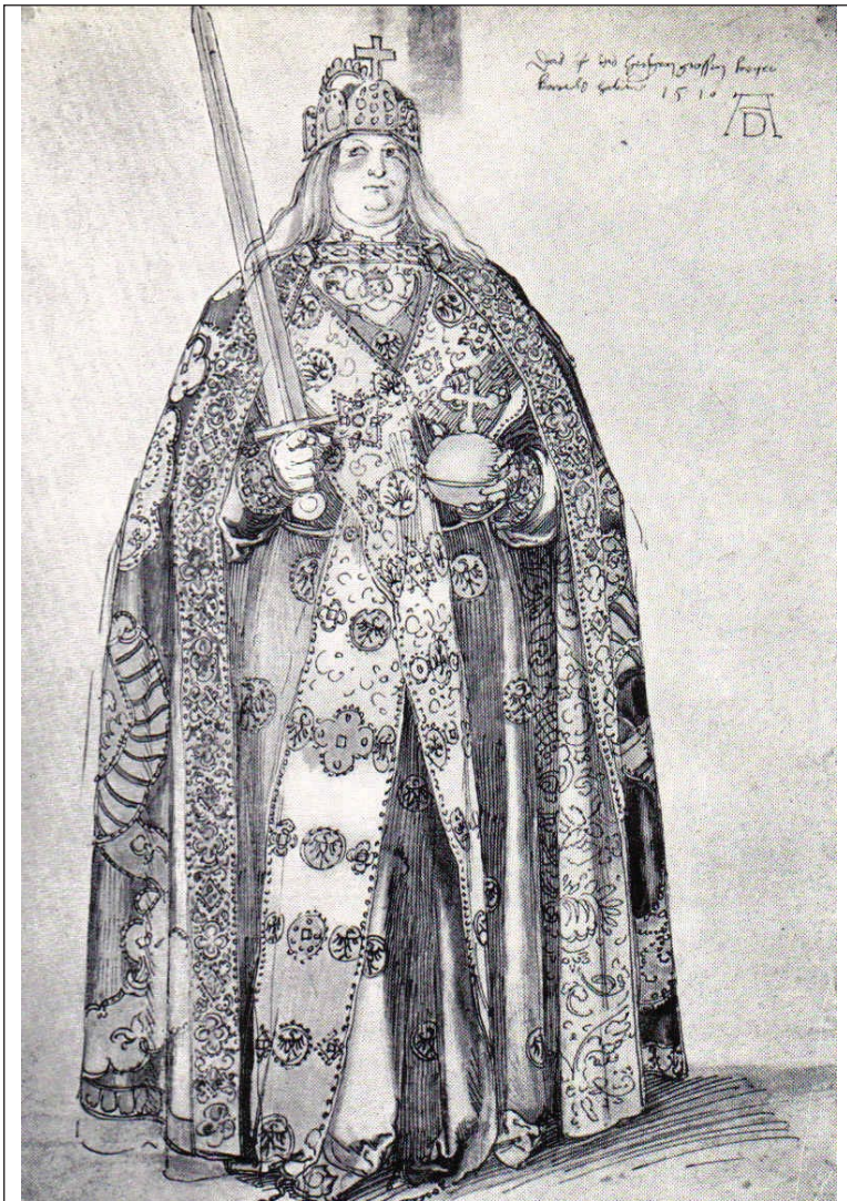
Karl der Große mit den Reichskleinodien, Studie zu einem Gemälde von Albrecht Dürer, um 1510