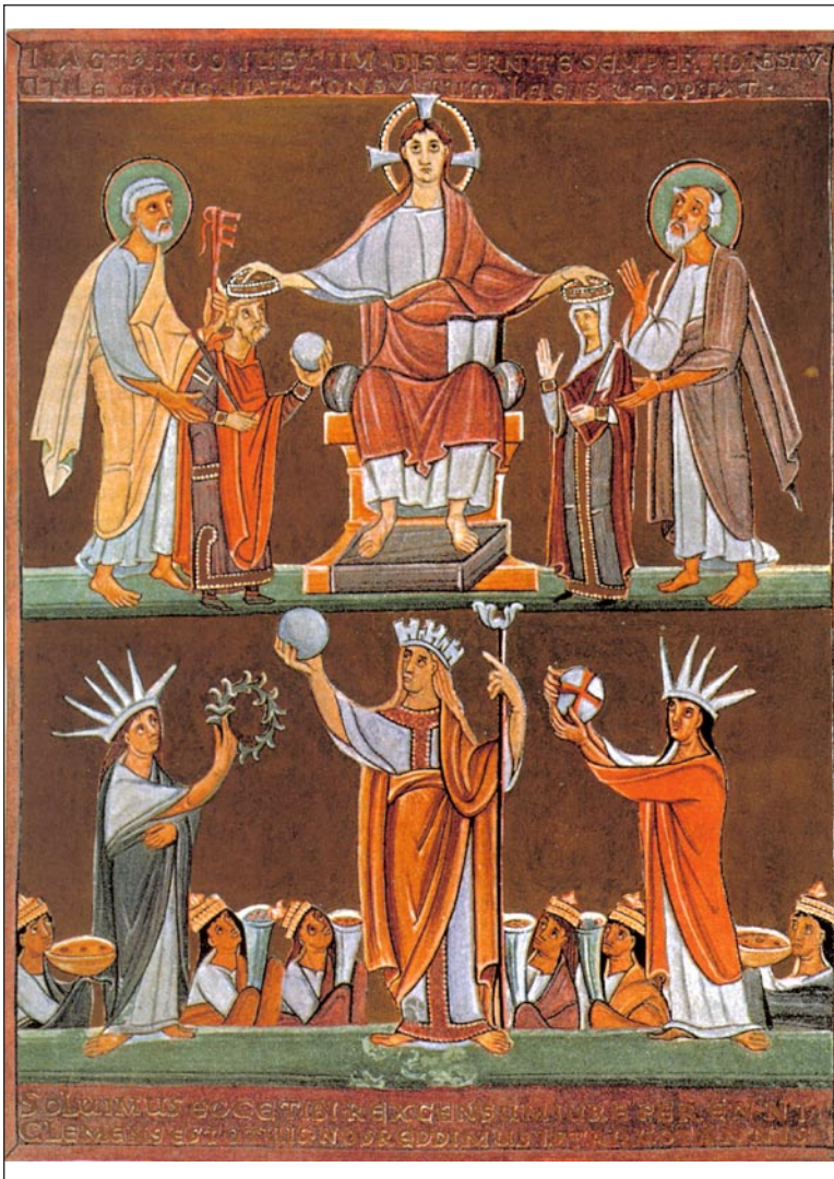
Kaiser Heinrich II. und seine Gattin Kunigunde, Darstellung aus dem Perikopenbuch Heinrichs, 11. Jahrhundert