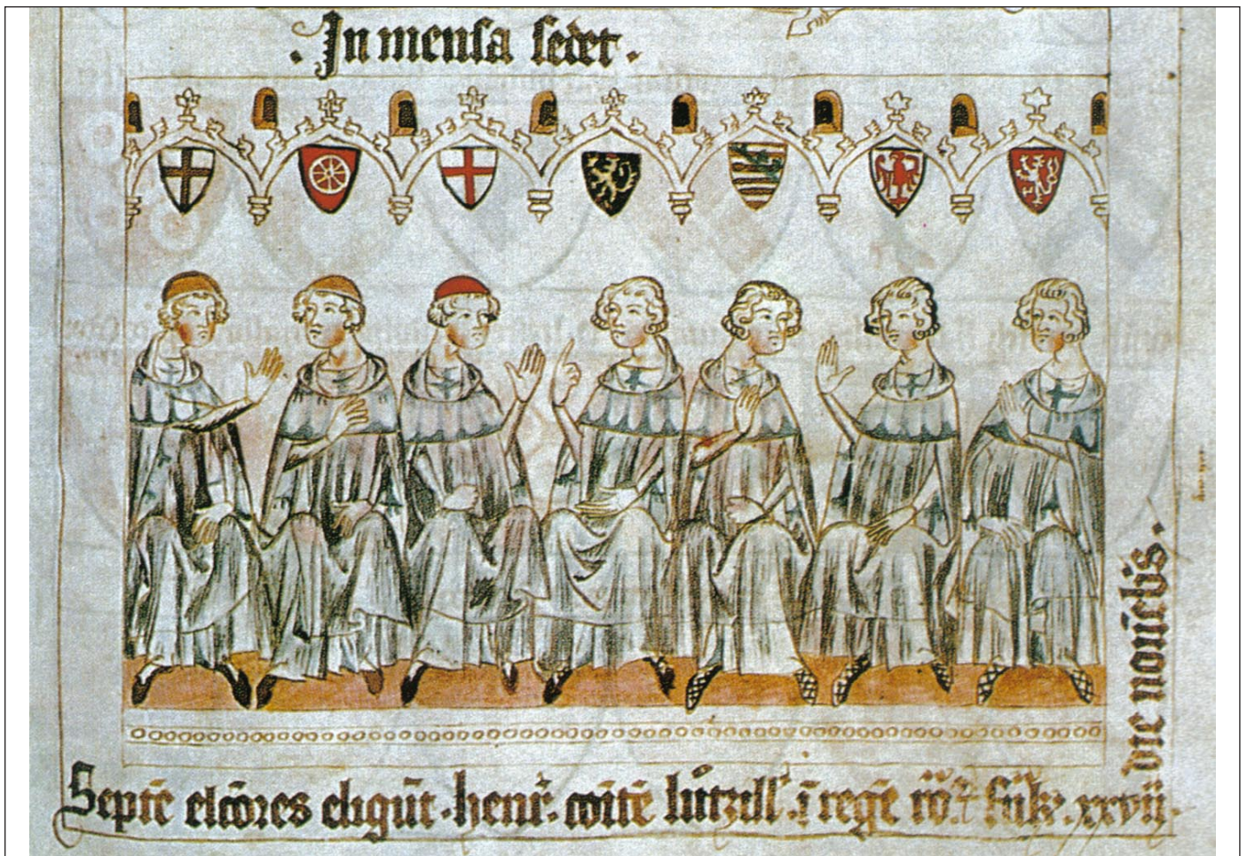
Die Sieben Kurfürsten wählen Heinrich VII. zum König, Miniatur aus der Bilderchronik Heinrichs VII. (Codex Balduineus), um 1310