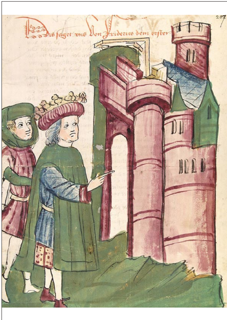
Friedrich I. Barbarossa vor der Stadt Tivoli, die er wieder aufbauen ließ, Darstellung aus der „Chronicon pontificum et imperatorum“, um 1450