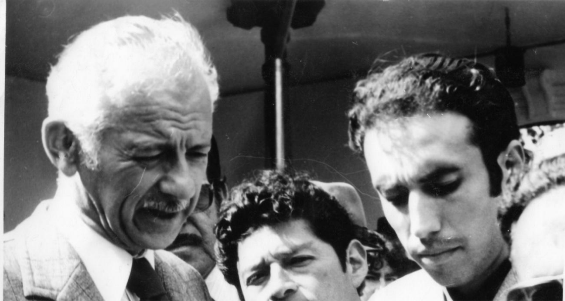
ENTREVISTA AL CANDIDATO PRESIDENCIAL SIXTO DURAN BALLEEN.-1.979.-EDUARDO PAREDEZ DE RADIO LATACUNGA - ARCHIVO PAREDES BAUTISTA.

AL NORESTE LATACUNGUENO, CON BIZARRIA DE VARON NEVADO, HALLASE EL ACTIVO COTOPAXI , REY DE LOS MONTES, SEÑOR DE LAS ALTURAS, GUARDIAN ETERNO DEL VALLE SERRANIEGO.