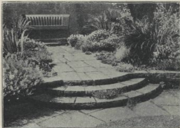
Fig. 5. Taras, schody przybrane bylinami.

Jeżeli grunt jest falisty lub choćby tylko stanowi zbocze wzgórza, urządza się kilka poziomów poniżej domu, zwykle stojącego na miejscu najwyższym. Otóż boki tych tarasów, odpowiednio, łagodnie pochyłe, obsadza się bylinami, a szczególnie