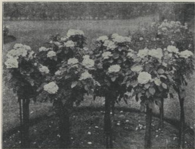
Fig. 4. Grządka z róż białych F. C. Druschki.

I odwrotnie, można dać przewagę warzywom i owocom (więc i kilka drzew karłowych, np. stoż-