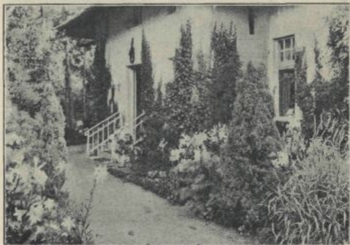
Fig. 2. Pnącze na domu, a przed domem grządka bylin.

(przeważnie). Zatem odtrąciwszy część zajętą pod budowlę, mamy tu \pm 800 \text{ m}^2 na ogródek. Na tej przestrzeni można go już urządzić nieco inaczej. Dom i budowlę okrywa się z zasady pnączami (fig. 2). Ogródek ozdobny robi się naokoło domu, stosując już obok