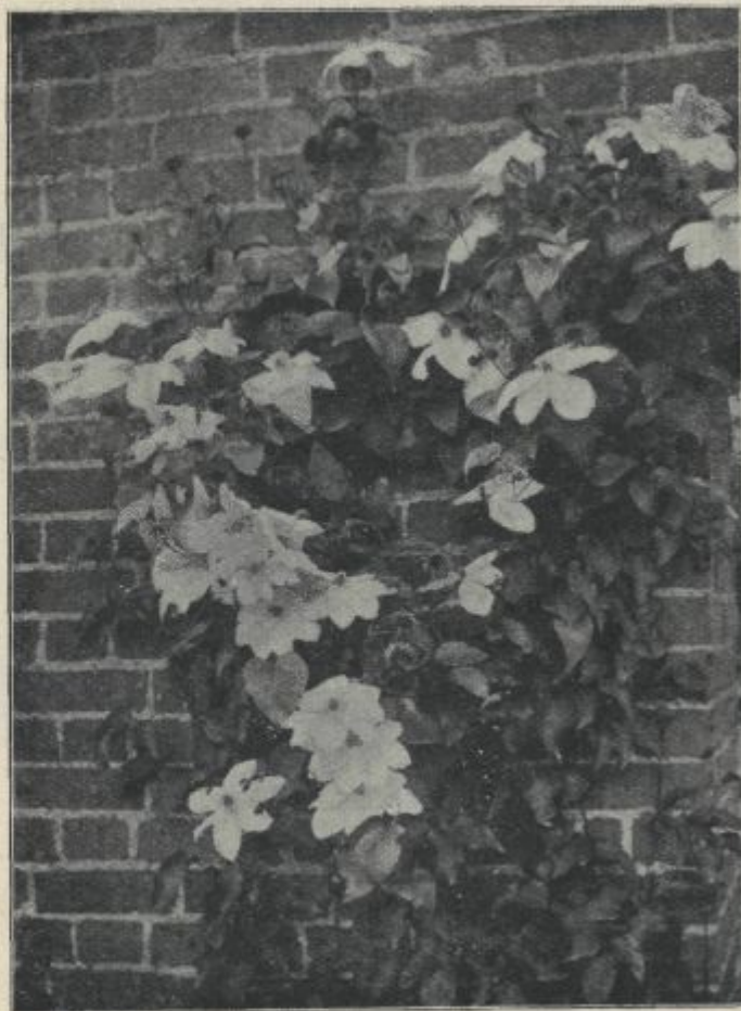
Fig. 1. Powojniki na ścianie domu.

Ze powodu wysokiej ceny ziemi w miastach place pod takie siedziby zawierają 1000 do 1200 m 2