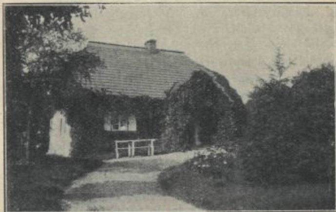
Domek Autora w Skarbonce.

Ale jakże to zrobić? Oto, o ile można, pracować w mieście, ale mieszkać poza niem. Praca wszelka (znów z przerwami wyjątkowymi) trwa teraz według