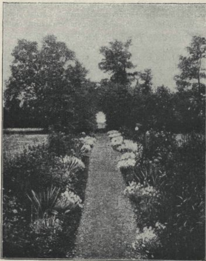
Fig. 6. Droga ukwiecona.

W górach sprzyja im bogactwo opadów, oraz obfite rosy.