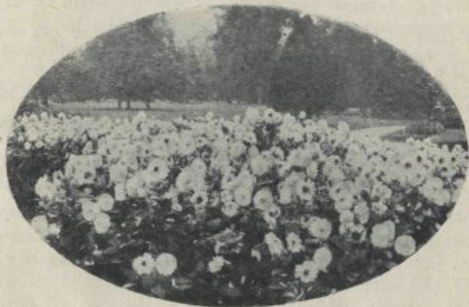
Fig. 7. Grupa ukośnic.

Ogródek warzywny na przestrzeni 600 do 800 m 2 , zaspokoi wszelkie potrzeby rodziny. Drugie tyle pod sad również wystarczy. Gdyby przestrzeni było mniej, zamiast piennych, posadzi się drzewa owocowe karłowe i szpalerowe. Wszystko to jednak są rady a raczej wskazówki, bardzo ogólne.