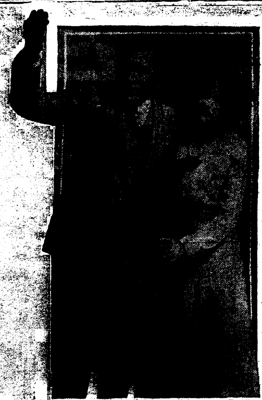
THE HOUSE OF GLASS AU TULANE