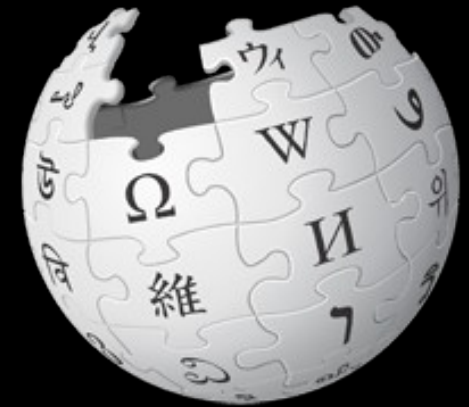
Répartition des articles de W ikipédia par langue Avril 2011