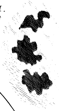
Fig. II. M. scutum 8 Aug