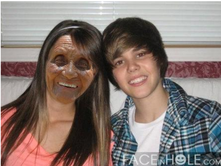
Petunia con su exnovio a los 16 a~os.