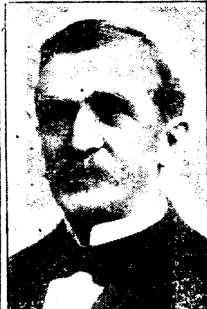
EMILE S. ECUIER Président de l'Union Française.

DATES DES REUNIONS — Réunions le premier jeudi de chaque mois.