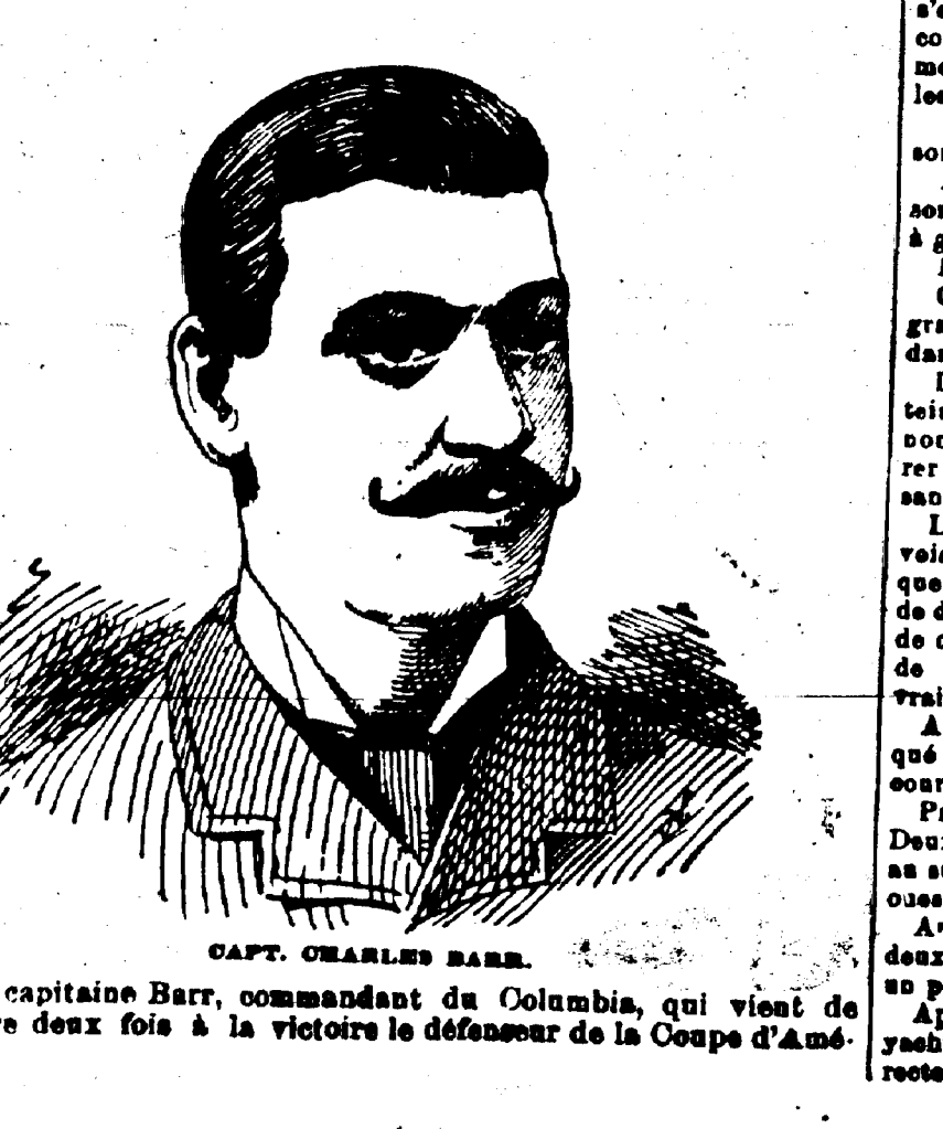
CAPT. CHARLES BARR. Le capitaine Barr, commandant du Columbia, qui vient de battre deux fois à la victoire le défenseur de la Coupe d'Amé-