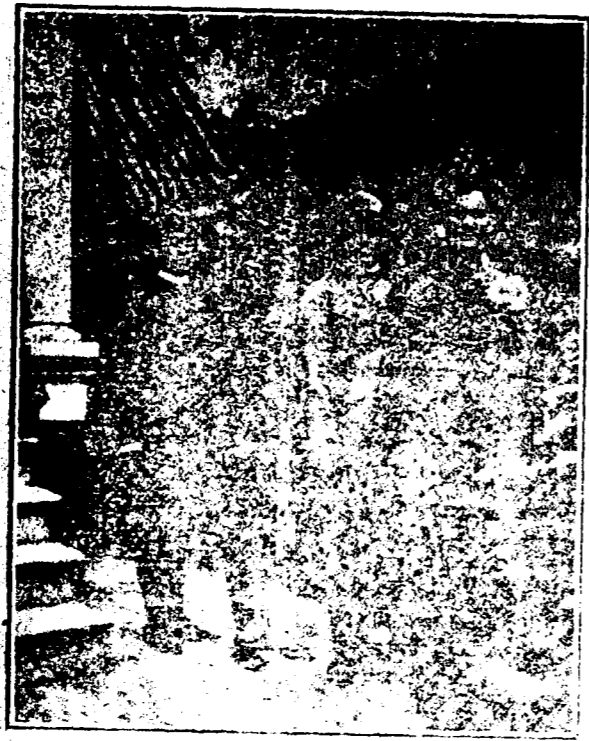
LES QUATRE FRERES TONGUIS.

LABORATOIRES BOTANIQUE 43, Chancery Lane, Londres, W. C. 1.