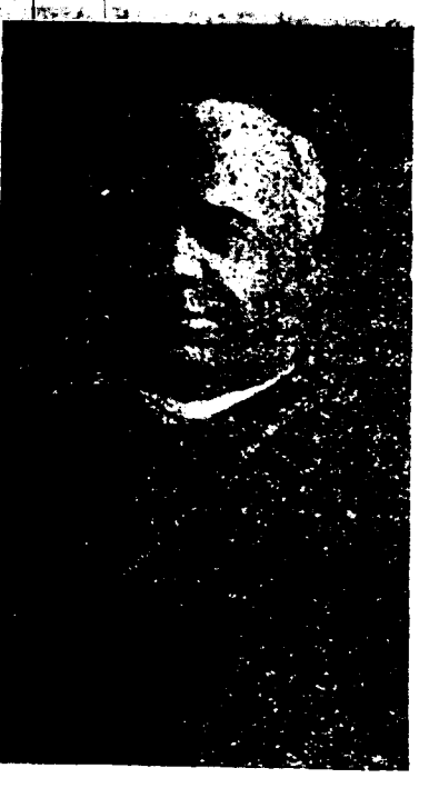
L'Archevêque Chapelle A CUBA. SŒURS RENVOYÉES DE CUBA.

Seattle, Wash., 14 mars— On a appris ici la découverte d'un riche terrain aurifère dans une mine située au niveau de la mer, près de Ketchikan, dans le sud-est de l'Alaska. La veine produit $40 la tonne et en certains endroits on a pu obtenir $60. D'après certains spéculateurs que l'on a pu se procurer, le rendement peut s'élever à $50,000 et même $60,000 la tonne.