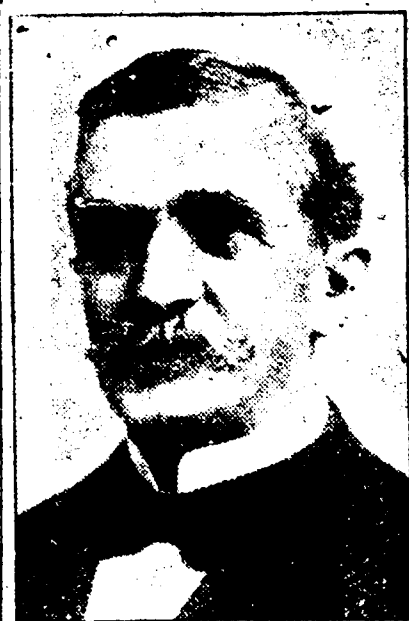
EMILE S. EUYER Président de l'Union Française.

DATES DES REUNIONS — Réunions le premier jeudi de chaque mois.