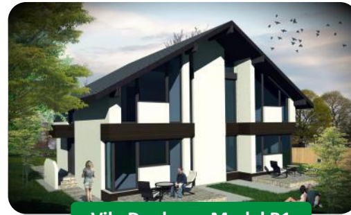
Vila Duplex – Model B1