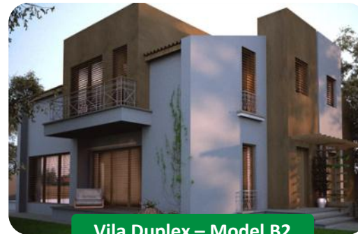
Vila Duplex – Model B2

Fiecare unitate locativa (casa) este dotata cu 2 locuri de parcare amenajate.