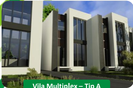
Vila Multiplex – Tip A