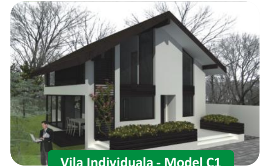
Vila Individuala - Model C1