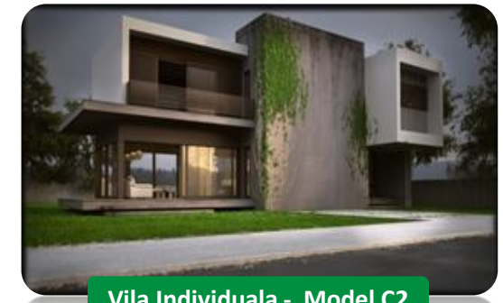
Vila Individuala - Model C2