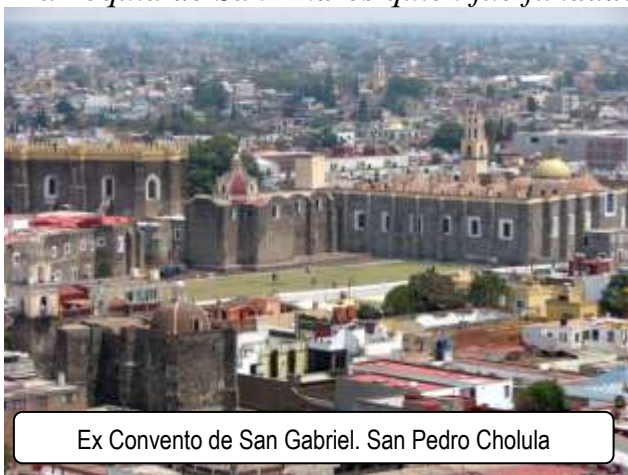
Ex Convento de San Gabriel. San Pedro Cholula

Ambos municipios mantuvieron un convento, en San Pedro Cholula era San Gabriel y En San Andrés Cholula fue San Andrés Colomoxco, aunque religiosamente la primera deidad fue San Diego de Alcalá quien fue abogado en el convento, hoy Parroquia de San Andrés quien fue fundado en 1557 desde Valladolid con la misión