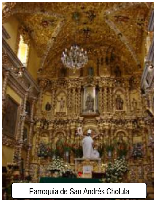
Parroquia de San Andrés Cholula

1641, El obispo Juan de Palafox y Mendoza secularizo a treinta y siete parroquias de franciscanos, agustinos y dominicos quienes fueron meticulosamente examinados en moral, teología y lingüística para no ser destruidos los curatos, sin embargo, la parroquia de San Andrés Cholula administró los sacramentales en la primera