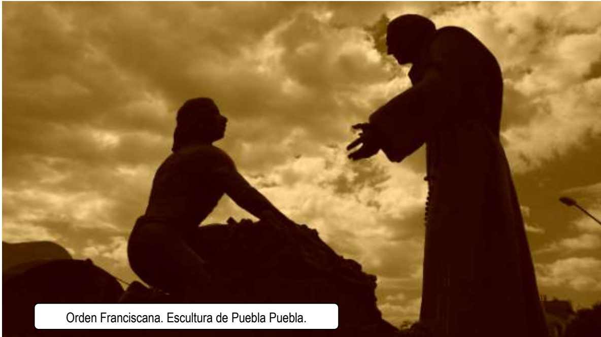
Orden Franciscana. Escultura de Puebla Puebla.

Ambos municipios mantuvieron un convento, en San Pedro Cholula era San Gabriel y En San Andrés Cholula fue San Andrés Colomoxco, aunque religiosamente la primera deidad fue San Diego de Alcalá quien fue abogado en el convento, hoy Parroquia de San Andrés quien fue fundado en 1557 desde Valladolid con la misión