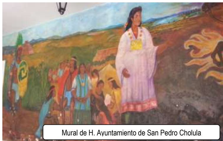
Mural de H. Ayuntamiento de San Pedro Cholula