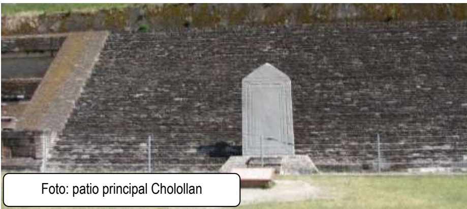
Foto: patio principal Cholollan

arqueológica llena de santuarios y lugares donde se ofrendaban tributos a los dioses del agua, de la fertilidad y del sol, así como del fuego y del viento. Se encuentra llena de un valle de flores y sonidos del cenizontle, colibríes y petirrojos y los ecos de la plaza principal del primer altar que es un monolito en forma de puerta a otra dimensión, en medio de grandes muros refleja su arquitectura labrada