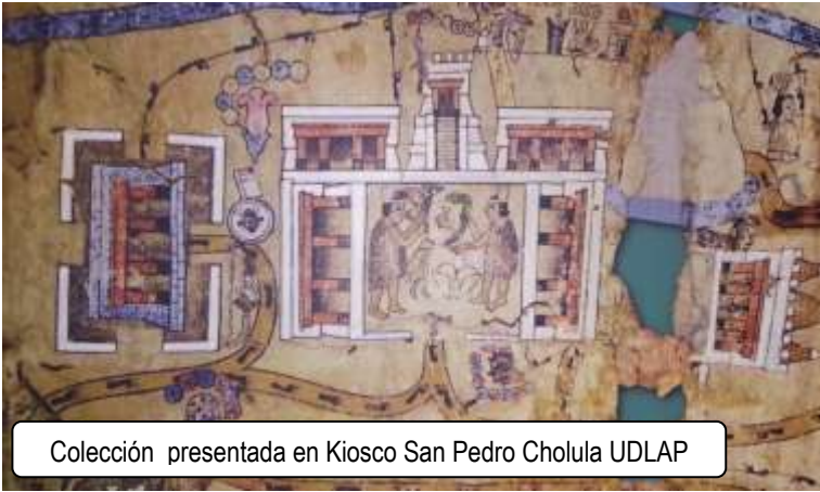
Colección presentada en Kiosco San Pedro Cholula UDLAP

Durante este periodo llegaron los Toltecas-Chichimecas al valle de Cholollan familias de la región tlaxcalteca que habían sido desterradas