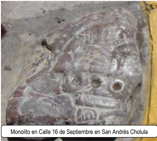
Monolito en Calle 16 de Septiembre en San Andrés Cholula

Más tarde, en la historia de los periodos Clásico que comprende del año 200 al 900 D.C., la nueva era del Teotihuacán sirvió para hacer de esta zona una “ciudad Sagrada” por lo que llegó a ser una de sus máximas corrientes de todo el Altiplano central, aunque