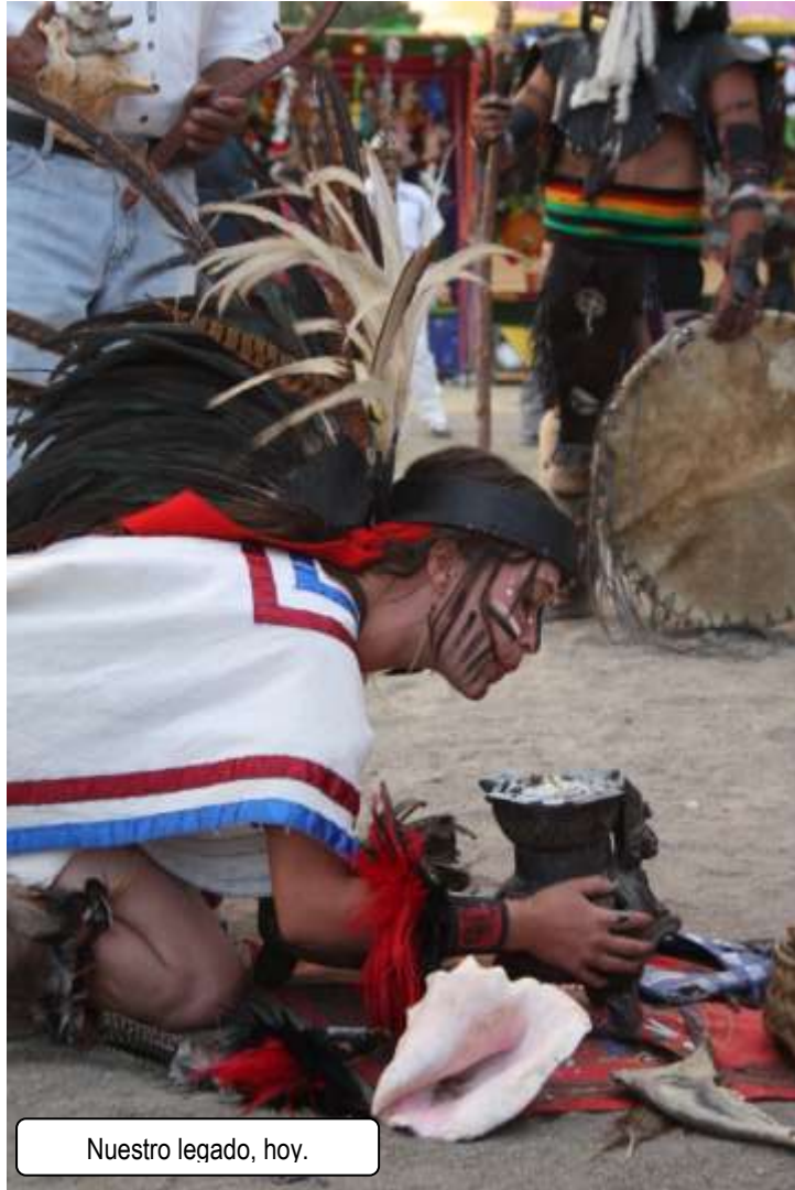
Nuestro legado, hoy.

Un legado de magia, de tradición y cultura que será preservado por todos nosotros a través de todos los tiempos en este lugar mágico.