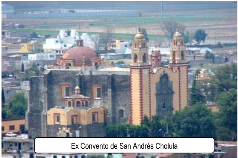
Ex Convento de San Andrés Cholula

municipios colindantes como Santa Isabel Cholula, Santa Clara Ocoyucan, San Bernabe Temoxtitlan y Santa María Malacatepec.