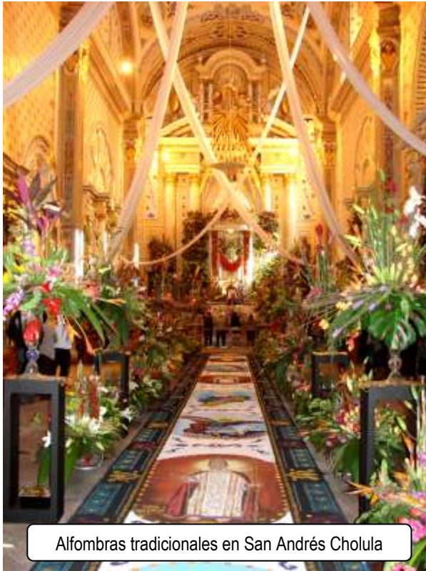
Alfombras tradicionales en San Andrés Cholula

Desde las mayordomías, las alfombras de flores y aserrín, el altepehuitil presentación de imágenes adornadas con mazorcas y calabacitas, la tlahuanca o festividad de los excesos de la bebida, fiesta de los pobres y de los labradores, la procesión de los faroles, la fiesta de la Virgen de los Remedios y fiestas religiosas y paganas como los carnavales, huehes, de las ferias tradicionales, las chinas poblanas, los trueques, quema de panzones y diablitos,