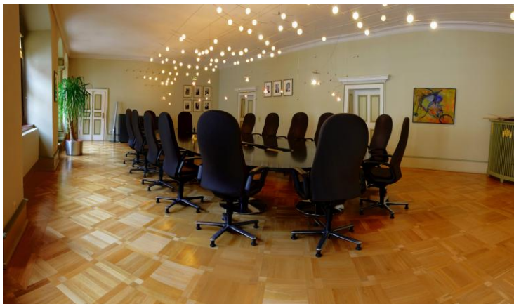
Olaf Kosinsky – Wikipedia in Parliament

Fotos: cc-ba-sa 3.0 from: User: Rob Irgendwer User: Martina Nolte User: Ralf Roletschek User: Ra Boe