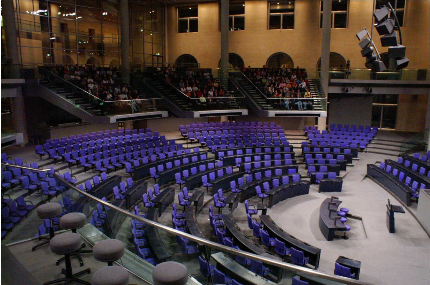
Olaf Kosinsky – Wikipedia in Parliament