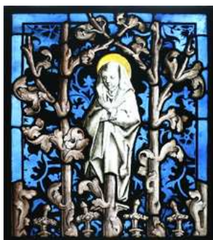
Peter von Andlau, Mater Dolorosa, 1480. The Metropolitan Museum of Art