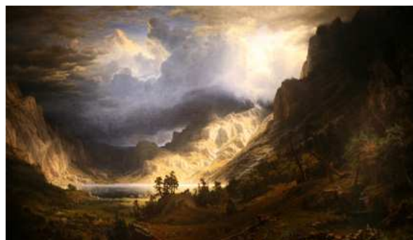
Albert Bierstadt, A Storm in the Rocky Mountains, 1866. Brooklyn Museum