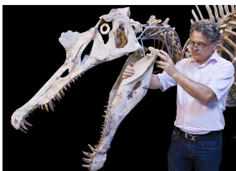
Un wikimédien photographie lors du projet Pheobus au Muséum de Toulouse.

Chacun de ces projets existe dans une multitude de langues et chaque année, plusieurs nouveaux sites émergent sous l'égide de Wikimedia, ce qui en fait le plus important groupe de diffusion du savoir, et ce, librement et gratuitement.