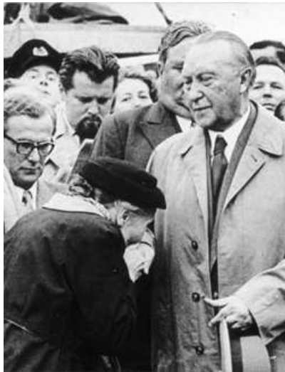
Konrad Adenauer à Bonn en 1955.