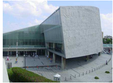
Bibliothèque d'Alexandrie, Égypte

Wikimédia et les institutions culturelles partagent un même objectif : l'accès le plus large possible à l'éducation et à la culture. De nombreux partenariats ont été conclus entre Wikimédia et des musées, bibliothèques et archives du monde entier (voir ci-après); ces partenariats ont montré l'apport considérable que les institutions culturelles peuvent représenter pour les projets de Wikimédia, grâce à la richesse et à la variété de leurs ressources. Ces partenariats ont également été à l'origine de retombées positives pour les institutions culturelles concernées, en termes de fréquentation et de visibilité. Ils ont été rendus possibles par l'accord des bibliothèques et archives concernées pour rendre disponible une partie de leurs ressources sous licence libre (voir ci-après).