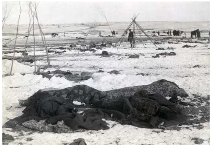
Impression à l'albumine du camp Big Foot après la bataille de Wounded Knee (Dakota-du-Sud, 29 décembre 1890).