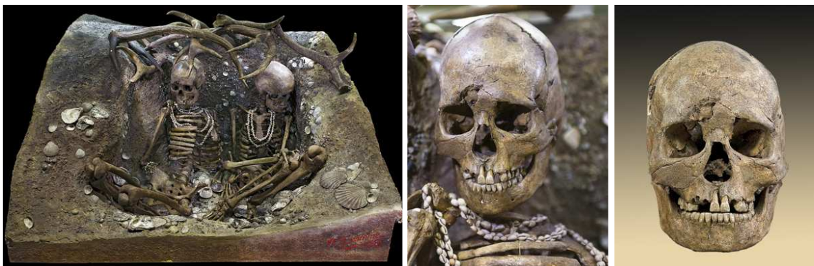
Sépulture de Thévieac - Muséum de Toulouse, France.