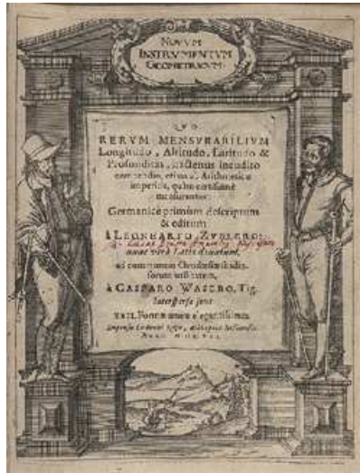
Traité de géométrie du XVII e siècle.