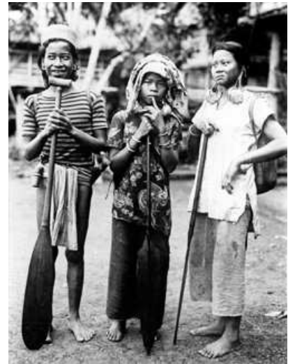
Trois jeunes filles à Bornéo en 1925. Tropenmuseum