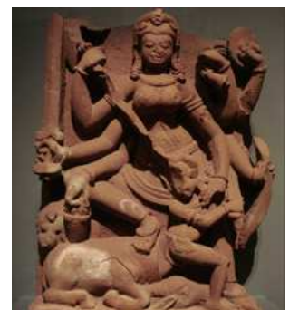
Sculpture indienne du IX e siècle. Los Angeles County Museum of Art