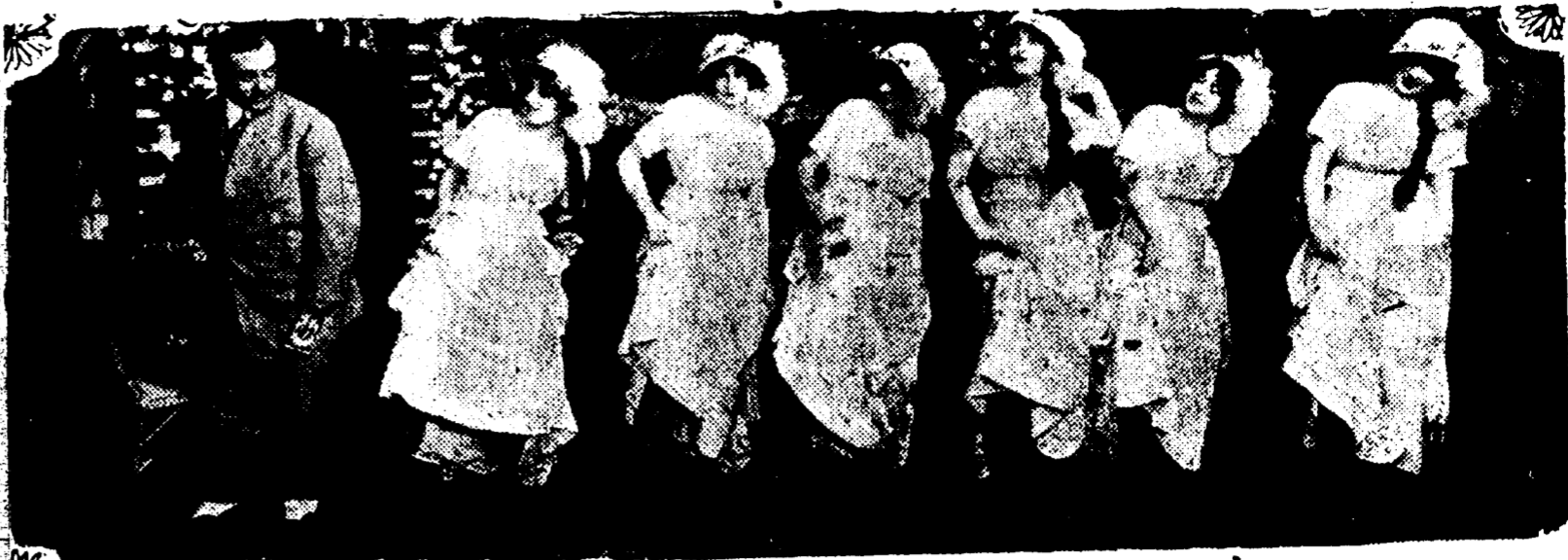
GRUPE DE CHŒUR PARFAIT DANS "THE PINK LADY", AU TULANE.

L'agent de police Lehman, a surpris en deux noirs inconnus qui roulaient un chariot contenant 200 livres de viande saisie, au coin Religions et St. Andrew, lorsque les voleurs aperçurent le po- licier, ils se sauvèrent laissant le har- di de viande sur la chaussée.