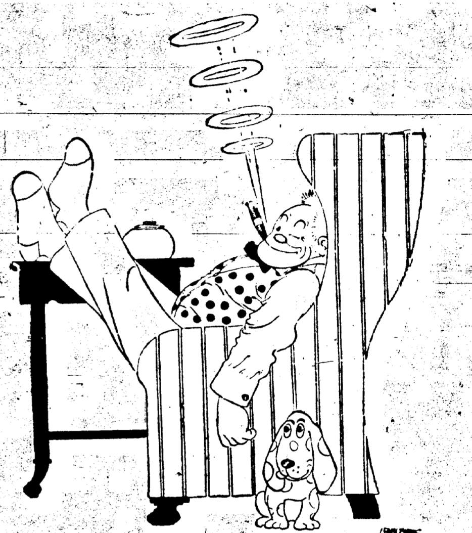
FATHER, DANS LA COMEDIE MUSICALE "BRINGING UP FATHER", A CRESCENT.