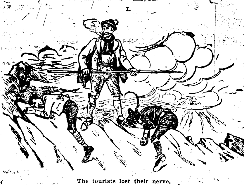
The tourists lost their nerve.