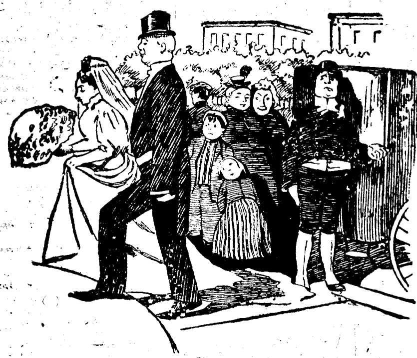
The Groom's Coachman: "Huh! she only gave me ten cents. I'm afraid we have made a mess of it!"