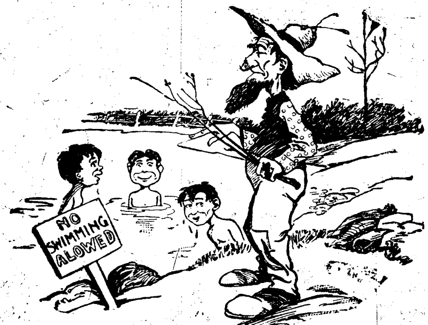
Farmer: "Hi! Can't yer read that 'ere sign, 'No swimmin' allowed'?" The Boys: "Dat's all right. Dere ain't no one of us knows how ter swim."