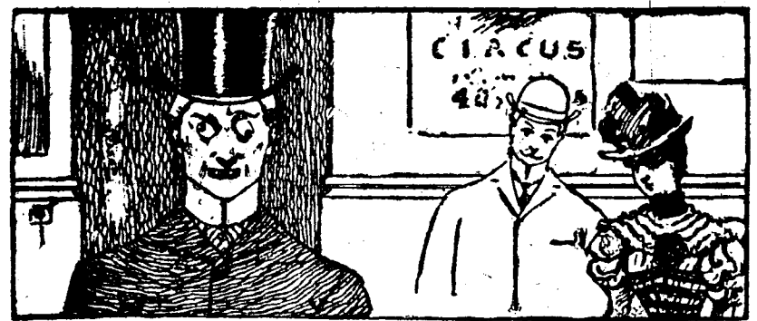
"Oh, what a pity! Did you see that young man's eyes? I wonder how they came so?" "Yes, that's poor Cross. He went to the circus and tried to keep tabs on four rings, seven trapezes and a chariot race all at once."