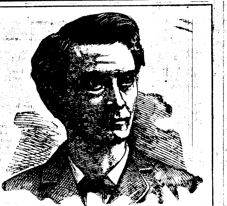
THOMAS E. WATSON.

Cincinnati, 2 octobre.—Une dépêche spéciale de Wheeling, Virginie de l'Occident, un Times-Star de Cincinnati, dit que pendant la parade d'hier soir, dans cette ville, un homme a tenté de frapper M. Bryan.