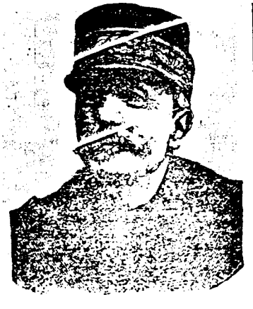
GENL. DE BOISDOFFREE.