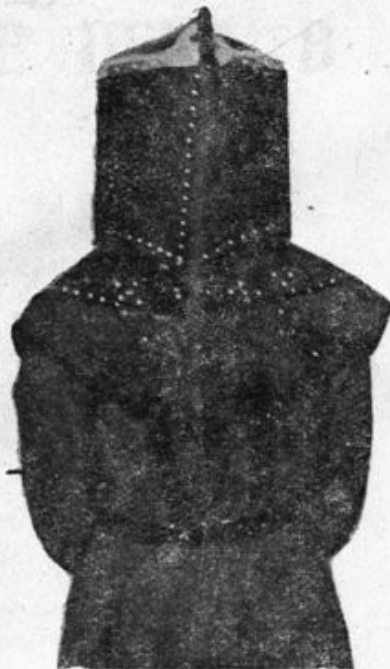
Рис. 3. Вид сзади.

тающих из сопла. Тем не менее при подаче воздуха до 180 л в минуту, наш шлем дает вполне удовлетворительную защиту.