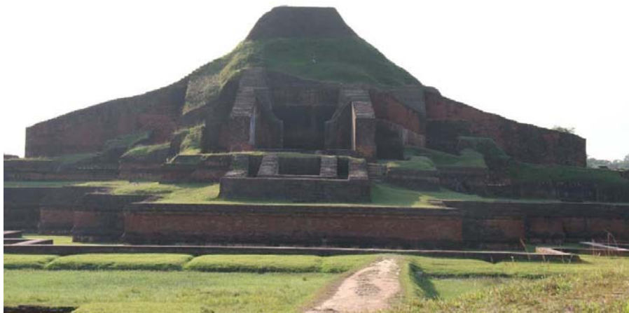
帕哈尔普尔佛教寺院遗迹

【教育】孟加拉国学制为小学至初中10年，高中2年，大学4年。现政府重视教育，规定八年级以下女生享受免费义务教育。全国有国立大学24所，私立大学54所。主要大学有达卡大学、孟加拉国工程技术大学、拉吉沙希大学等。孟人口识字率为62.66%，其中男性为65.94%，女性为58.69%，成人识字率为54.80%。