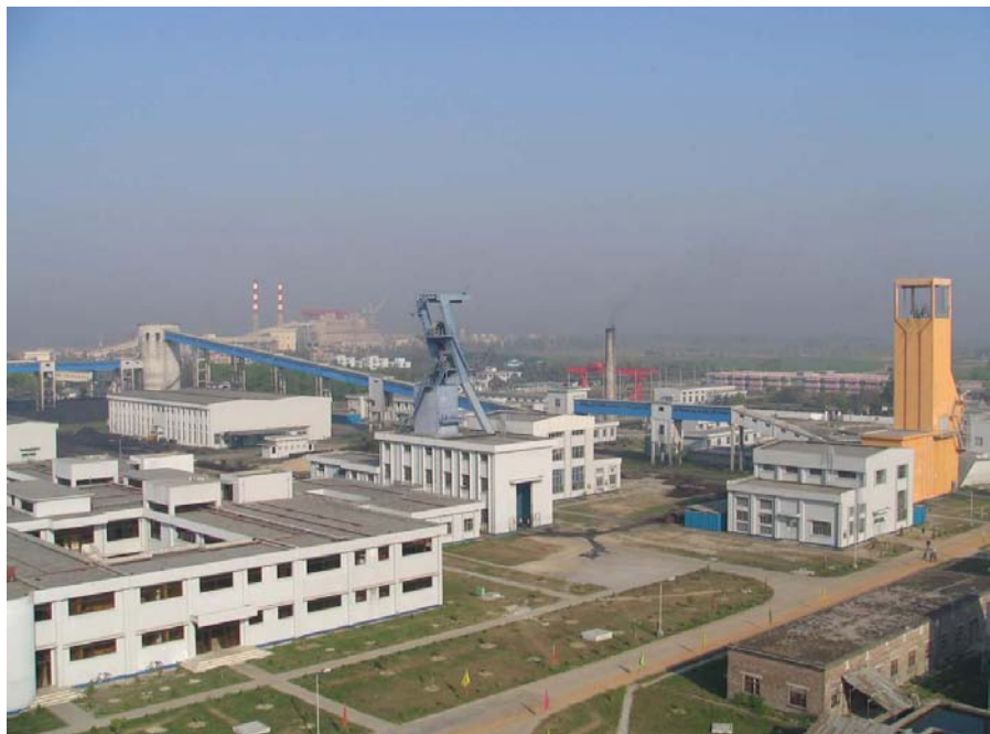
中国在孟最大承包项目—巴拉普库利亚煤矿和电站