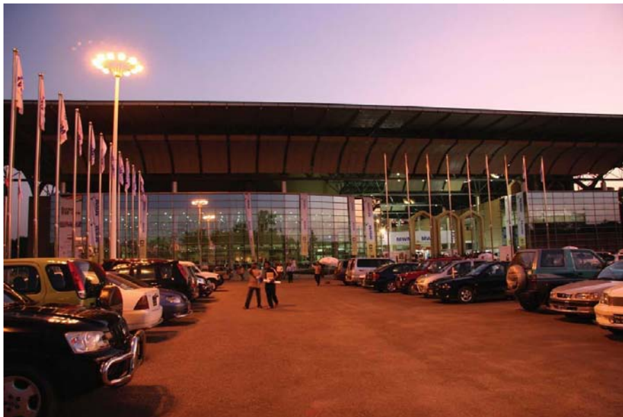
中国援孟项目——孟中友谊会议中心

截至2009年，中国累计在孟注册147家企业，注册资金2.28亿美元。其中，独资56家，合资91家；中方累计投资额约8100万美元。投资领域涉及服装、纺织、陶瓷、装修、饮用水、医疗、养殖、印刷、家电、轻工等，但主要集中在纺织服装及与之相关的机械设备等领域。主要投资企业有中孟陶瓷公司、运城制版孟加拉国公司、利兹服装公司等。