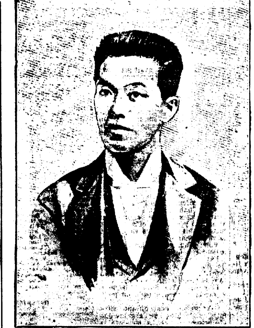
AGUINALDO. Capture du chef philippin.

M. Gummere va probablement entrer de nouveau en communication avec le gouvernement marocain pour fixer la date d'une entrevue.