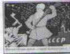
6.- _____ ist Russland die Sowjetunion.