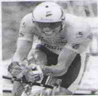
3.- Indurain gewinnt die Tour im Jahr _____.