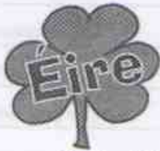
5.- Südirland ist die Republik Éire im Jahr _____.