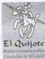
9.- Cervantes schreibt "El Quijote".