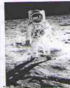
2.- _____ landet der Mann auf dem Mond.