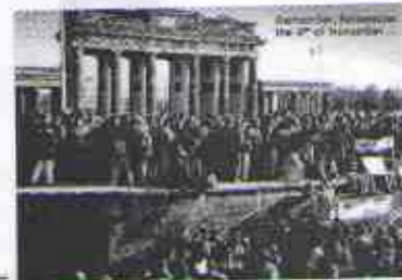
11.- Die Berliner Mauer fällt _____.