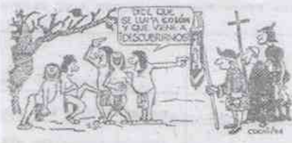
1.- _____ entdeckt Cristopher Columbus Amerika.