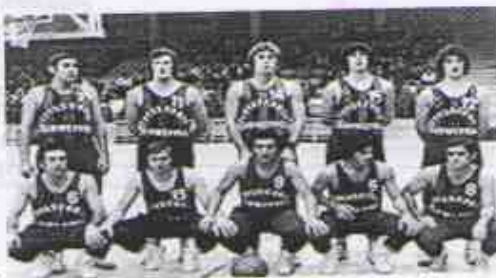
7.- _____ gewinnt Tau das Liga ACB.