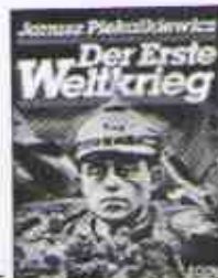
10.- Der Erste Weltkrieg dauert von _____ bis _____.