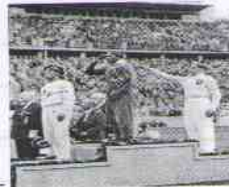
8.- _____ gewinnt Jesse Owens die Goldmedaille in Berlin.