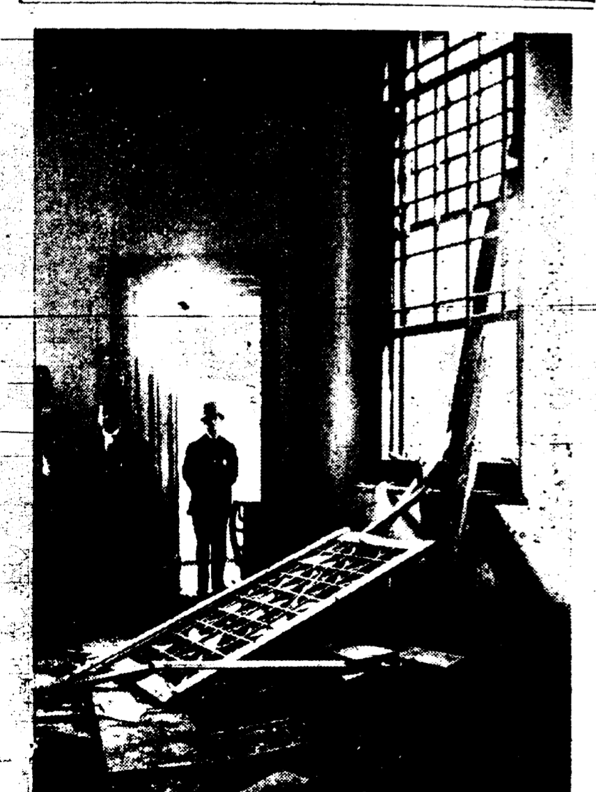
L'endroit où a éclaté la bombe.

Les mouvements louches de ces deux individus ont été observés par l'entrepreneur Sandrini.