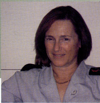
Architect Colonel Ofra Rahav, Commander of the IDF Building Center

התעמקות בפעילות המקצועית של אחד הגופים הגדולים ביותר בשוק הבנייה הישראלי, עלולה להיתפס כמאמר 'מטעם', ולא בכדי. על אף ההתמקדות בבנייה בבסיסי הצבא, מרכז הבינוי של צה"ל הוא אחד הגופים המשפיעים ביותר על האדריכלות הישראלית. שכן, לצורך ביצוע תפקידיו המגוונים, המרכז צורך את שירותיהם של מיטב האדריכלים, המהווים, בין היתר, צינור להחלפת מידע עם השוק האזרחי. מטרת המאמר הזו היא איפוא, לאפשר הצצה אל עולם האדריכלות שמעבר לגדר, תוך הבלטת הפן היצירתי המתפתח שם בשנים האחרונות.